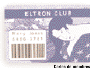
Cartes de membres