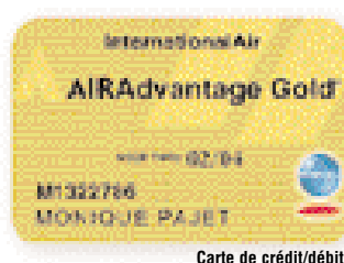
Carte de crédit/débit