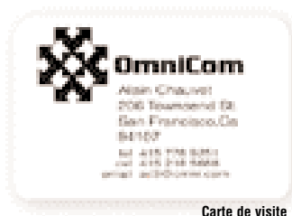
Carte de visite

Note 2 : Pour un résultat optimum, Eltron recommande l'utilisation de consommables "True Colours"