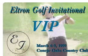
Laissez-passer pour manifestations