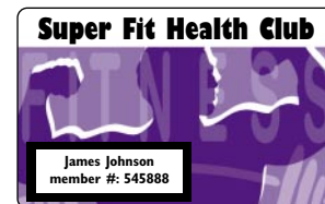
Carte de membre