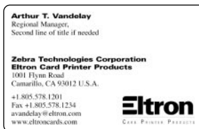
Carte de visite