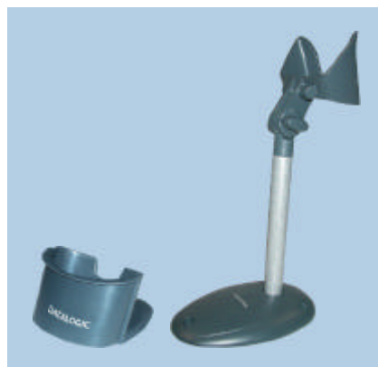
SPC Heron™ G et STD Heron™ G